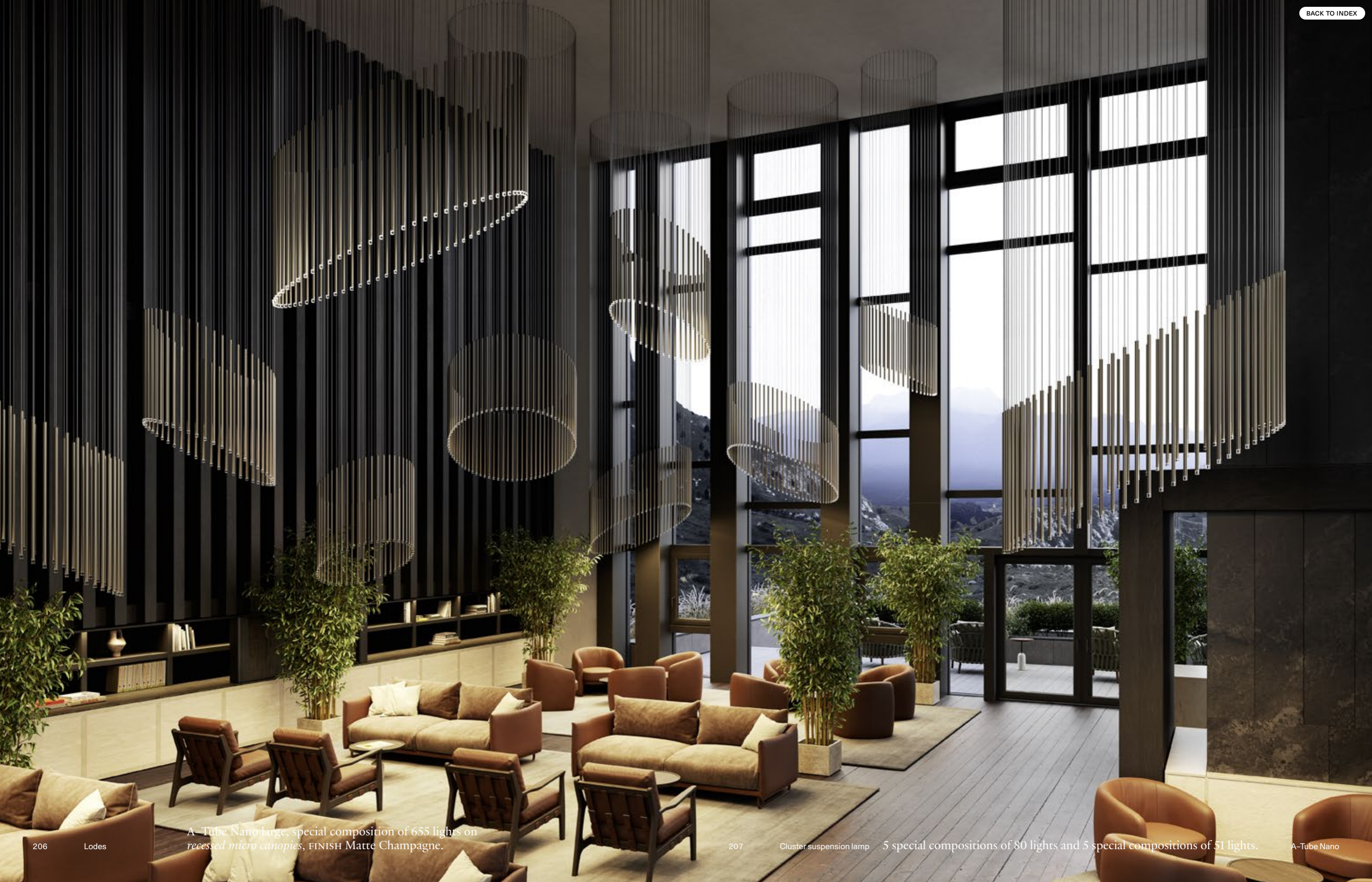
A- Tube Nano large, special composition of 655 lights on recessed micro canopies, FINISH Matte Champagne.