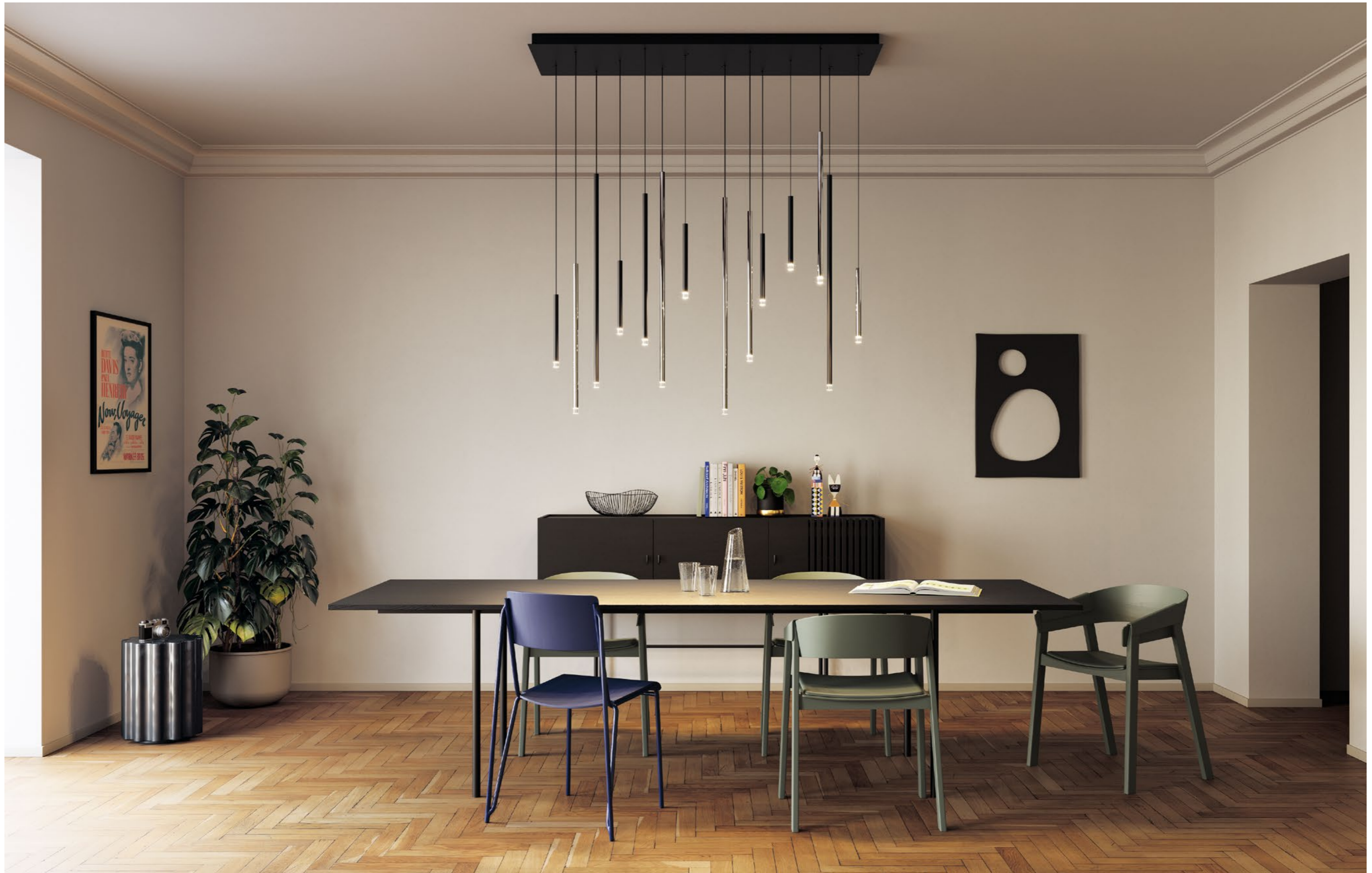
A- Tube Nano small, medium and large, composition of 14 lights on a rectangular canopy , FINISHES Matte Black and Chrome, black cable version.