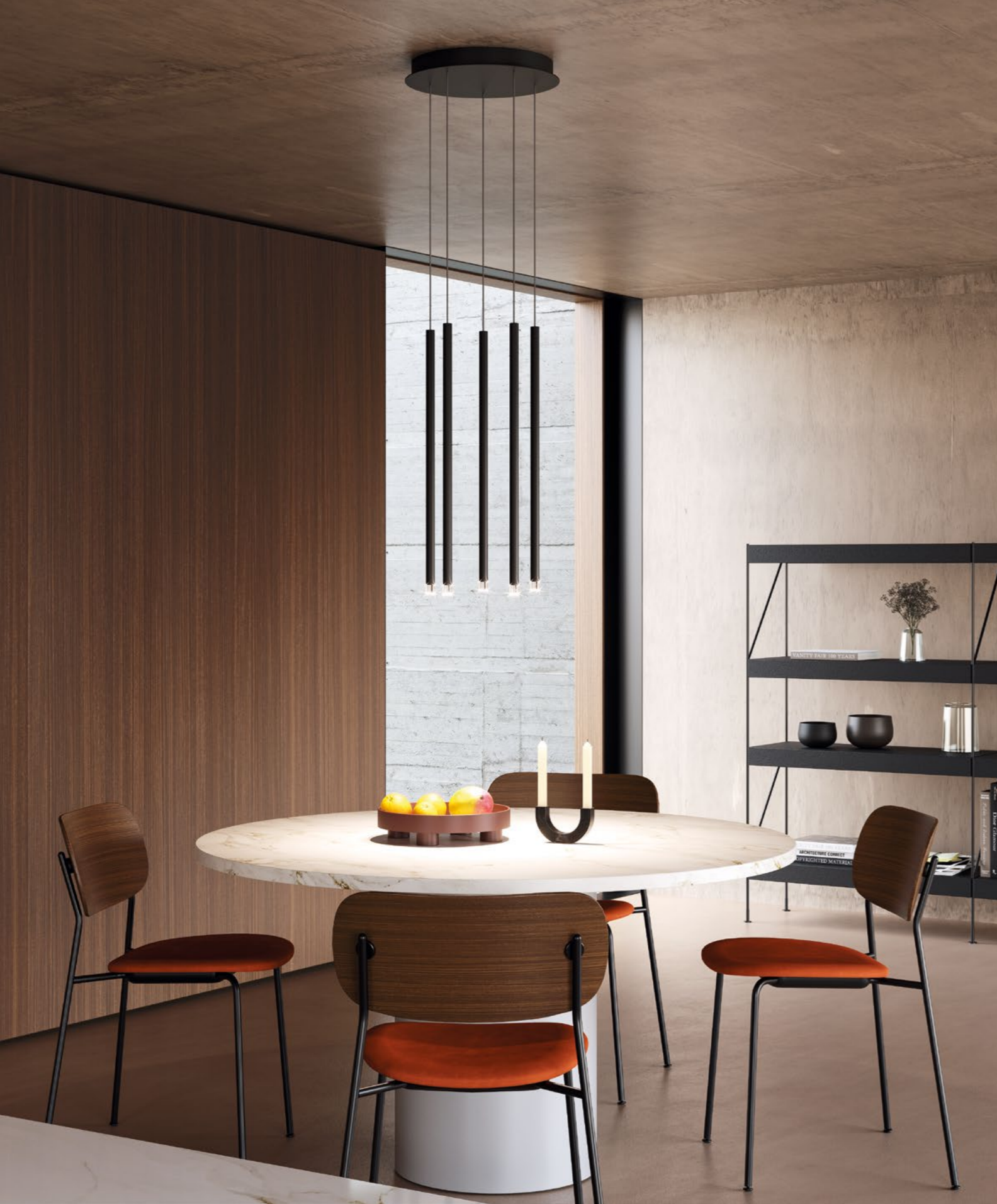
A-Tube Nano medium, composition of 5 lights on a round canopy , FINISH Matte Black.

A- Tube Nano est une suspension qui interprète la lumière dans sa forme la plus essentielle en dessinant une fine ligne lumineuse dans l'espace de vie. À l'extrémité inférieure de la structure en aluminium léger, un diffuseur en méthacrylate transparent abrite un module LED dont la lumière crée une atmosphère douce et enveloppante. Les trois dimensions et les six finitions polyvalentes permettent de créer des compositions évocatrices en cluster. ●FR