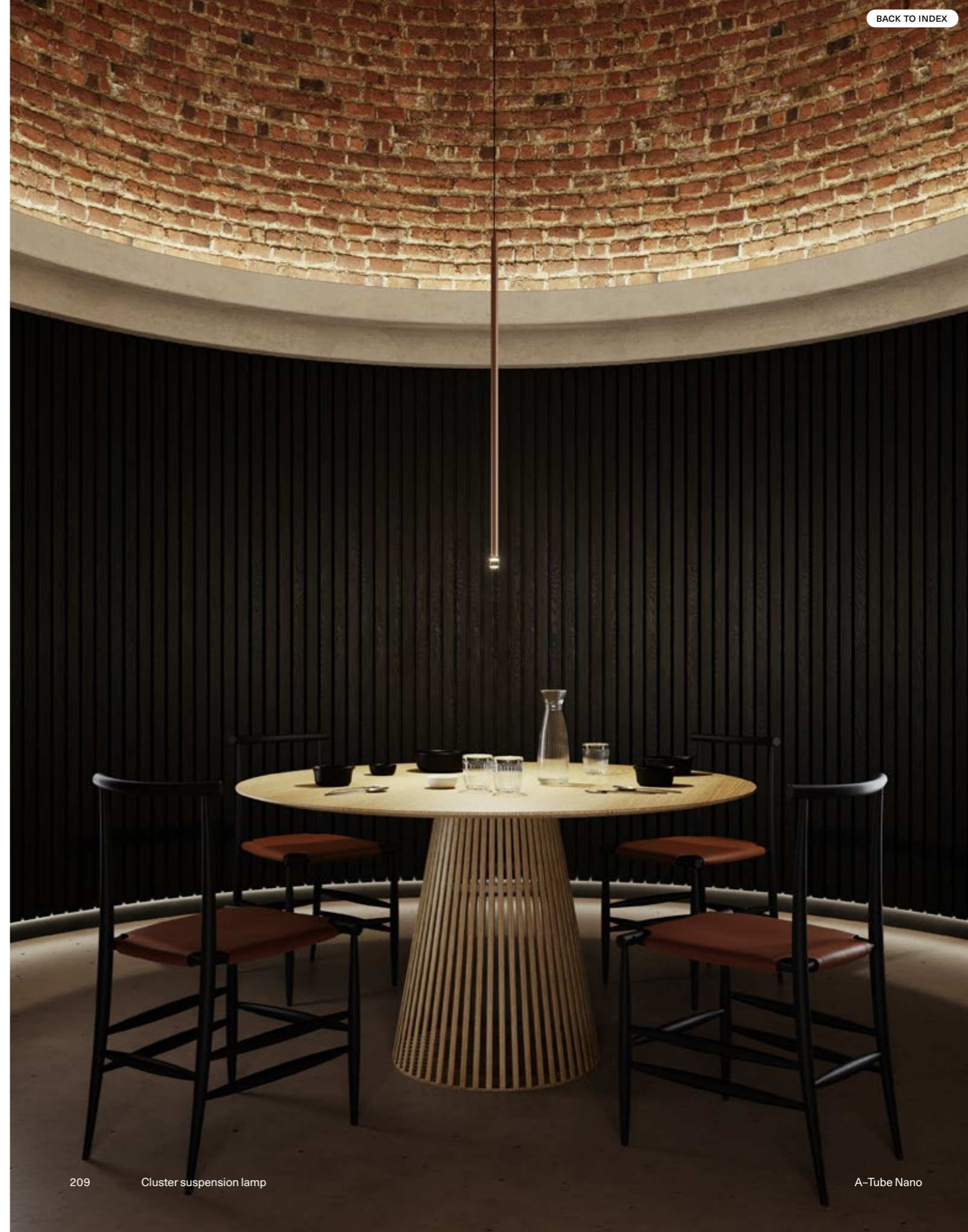
A-Tube Nano large, recessed micro canopy , FINISH Terra, black cable version.